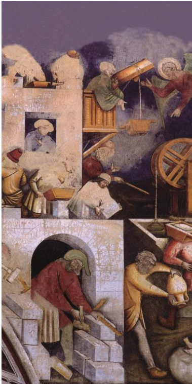
Détail d'une fresque dans l'église S. Catarina (Galatina, Pouilles, Italie)