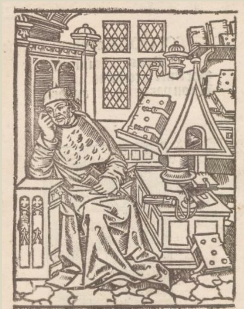
Bernard de Gordon, La Fleur de Chirurgie , Paris, J. Petit, 1504, frontispice.

Maison des Sciences de l'Homme Paris Nord 4, rue de la Croix Faron 93210 Saint-Denis La Plaine