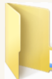
Texte de votre œuvre

Premièrement, il faut créer un dossier nommé d'après le titre de votre livre sur votre bureau →