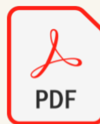
Fichier exporté en .pdf