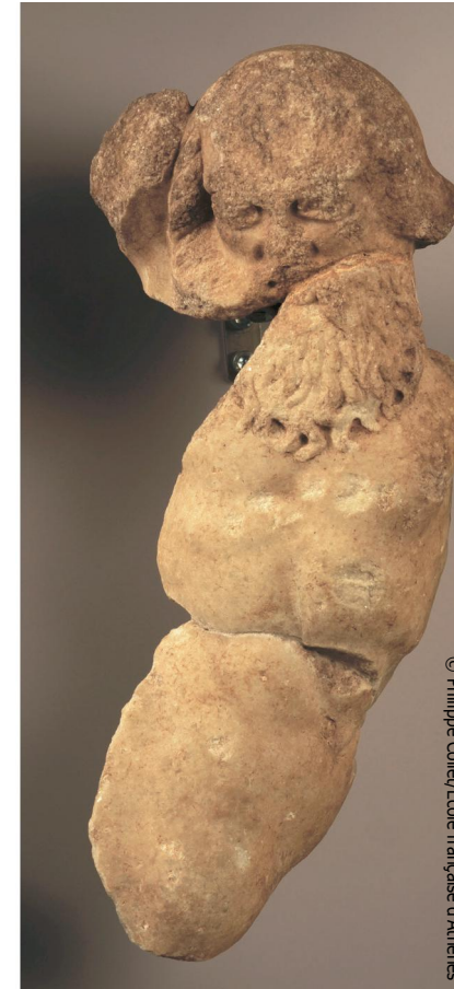
Centaure combattant (Delphes, Tholos, Grandes Métopes, Musée, inv. 4313)

Vendredi 18 octobre 2019 Université Paris Nanterre - Bâtiment Max Weber Salle des Conférences