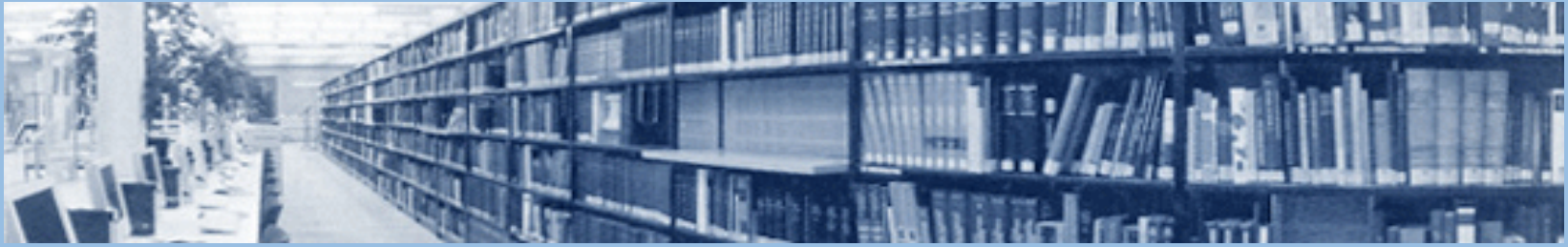
Table of Contents (TOC)