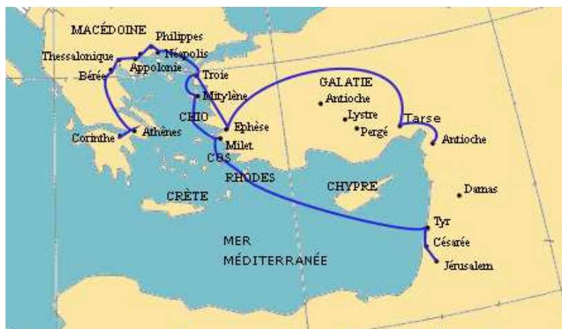
Les trois voyages missionnaires de Saint Paul (de 45 à 58 environ)