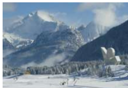
Le Monument national à la Résistance de Gilioli © Laurent Guette / CG74

En raison d'un contexte spécifique (zone libre, milieu alpin, occupation italienne, proximité avec la Suisse, etc.), la Haute-Savoie a été fortement marquée par la Résistance, comme en témoignent par exemple les événements du maquis des Glières et surtout la libération du département, dès le 19 août 1944, par ses propres forces. Les associations d'anciens Résistants et Déportés ont été très actives après-guerre pour organiser des activités de rencontres, de soutien des familles et de publications de revues. Elles ont également contribué à de nombreuses réalisations : le cimetière des Glières, devenu nécropole nationale des Glières en 1984, deux musées de la Résistance en deux points du département (Morette et Bonneville), un mémorial de la Déportation (Morette),