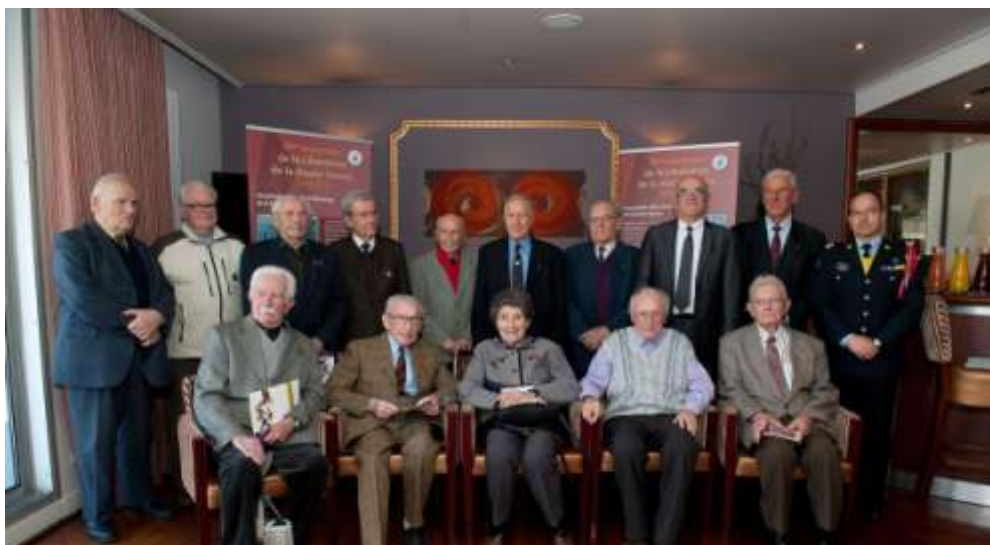
De nombreux Résistants et Déportés étaient présents lors du lancement officiel des commémorations du 70 e anniversaire de la Libération de la Haute-Savoie, le 28 janvier 2014, à l'Hôtel Splendid à Annecy, lieu où a été signée la capitulation allemande le 19 août 1944

Au-delà de ces principales commémorations, de nombreuses communes et associations du département se sont investies dans l'organisation d'évènements ou de manifestations.