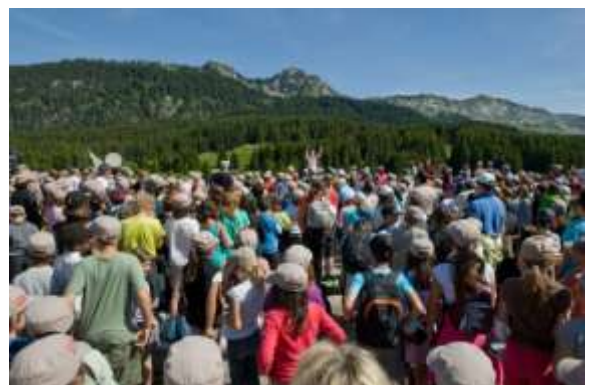
Opération Rando- Glières. Chaque année, le Conseil général propose à plus de 2000 jeunes de se rendre sur le plateau des Glières, pour une journée entre randonnées et mémoire

Cette transmission aux générations nouvelles, par le truchement de l'actualité des valeurs de la Résistance, débutera donc par une journée de travail consacrée à exposer des témoignages d'expériences (ou de pratiques) pédagogiques et à présenter leurs outils dédiés. Elle se prolongera tout au long des commémorations par une exposition itinérante expliquant et illustrant l'orchestration progressive de cette mémoire collective, ces 70 dernières années. Dans le même esprit, le 27 ème Bataillon de Chasseurs Alpins, qui fut un vivier pour l'encadrement des maquis, notamment à Glières, et qui fut reconstitué à l'automne 1944 à partir de ces mêmes maquis, à parité AS et FTP, sera étroitement associé, autant que ses engagements opérationnels le permettront.