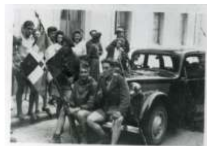
Un groupe de maquisards et la Traction du corps-franc Breton après la libération de St-Julien

Le 18 août au soir , reste une seule garnison allemande, celle d'Annecy, la plus importante, mais vers laquelle convergent toutes les forces du département (la radio suisse parle de « 13000 maquisards »...). La Résistance propose une rencontre au colonel Meyer, commandant les 3000