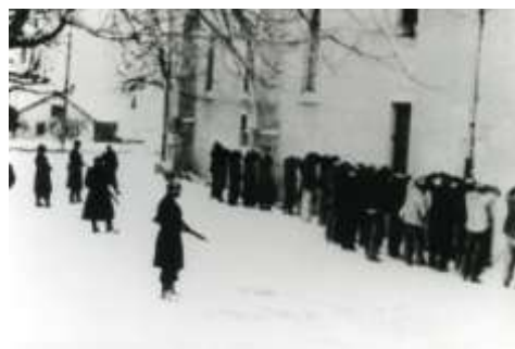
Rafle à Féternes

Du 6 au 26 février, le Chablais va connaître une quinzaine sanglante . Les miliciens organisent la chasse à l'homme, à partir de leur repaire de la Grange Allard. Le 20 février, les forces de police se concentrent sur Féternes , PC du 1 er bataillon FTP de Maurice Flandin qui sera torturé à mort. La milice encercle des refuges de Résistants, le 21 à Verdisse, puis le 22 à Foges. Ces derniers résistent plusieurs heures (6 tués, 1 prisonnier qui sera fusillé, 5 rescapés continueront le combat). Le 25 février, 6 combattants FTP sont condamnés à mort par la cour martiale de Thonon et fusillés le lendemain matin dans la cour de l'école-hôtel du Savoie-Léman.