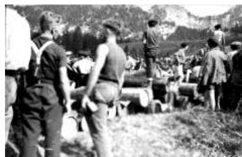
Réception des armes au Plateau des Glières le 1 er août

Mardi 1 er août : Plus de trois mille hommes convergent vers Glières : environ deux mille pour la réception sur le Plateau et un millier dans les vallées, pour la protection du site. Ils reçoivent une centaine de tonnes d'armes, de munitions et d'explosifs qui sont immédiatement répartis dans le département. Mais l'ordre est d'attendre le débarquement prévu en Provence avant de passer à l'action.