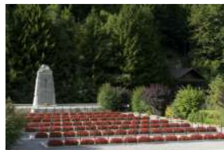
La Nécropole Nationale des Glières, à Morette