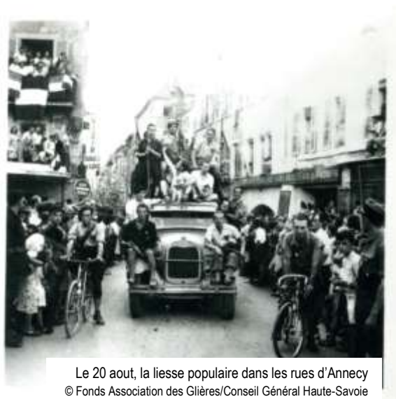
Le 20 août, la liesse populaire dans les rues d'Annecy

L'« Etat Français » se substitue à la République. La démocratie, les Communistes, les Francs-Maçons, les « apatrides », les Juifs sont accusés d'être responsables de la défaite. La « Révolution Nationale » veut restaurer la « France éternelle », catholique et rurale et ses « valeurs traditionnelles » illustrées par la devise « Travail, Famille, Patrie ». En Haute-Savoie, très catholique et paysanne, ces thèmes peuvent initialement trouver un écho.