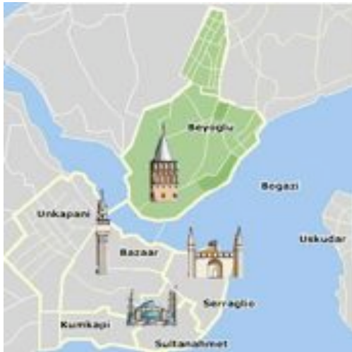
Figure 1 : Carte des quartiers historiques d'Istanbul. En Vert, le quartier de Beyoğlu