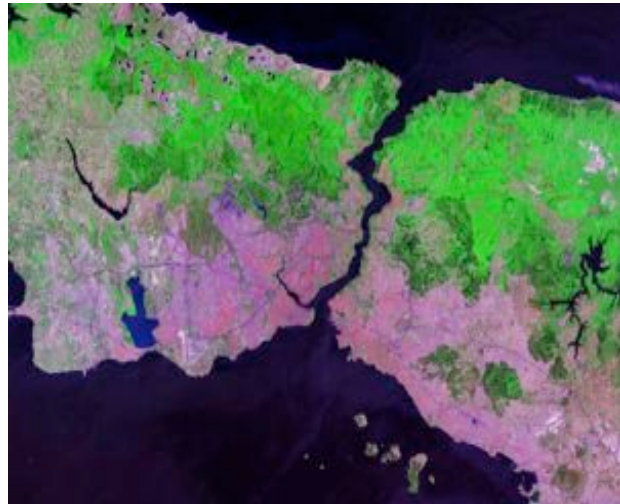
Figure 2 : Carte des emprises urbaines (rose) d'Istanbul

Au regard de l'histoire, le quartier de Beyoğlu, l'un des plus anciens de la ville, est emblématique de l'influence occidentale sous l'Empire Ottoman. Au XIXe siècle, il en est devenu le centre financier, des ambassades et des lycées étrangers. La présence de ces minorités attestait du cosmopolitisme de ce quartier connu à l'époque sous le nom de Pera. Jusqu'au milieu du XXe, s'y déroulait l'essentiel de la vie culturelle et nocturne stambouliote. Puis, à la suite de révoltes sociales et offensives populaires nationalistes, le départ contraint des étrangers, et particulièrement des grecs, a conduit au déclin de l'activité du quartier, qui hébergea dès les années 1970 les migrants internes d'Anatolie.