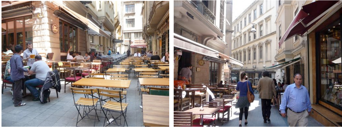
Photos de Tünel Asmalımscit, prises en juin 2010 avant l'interdiction de disposer des tables.