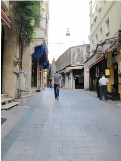
Photo de la même rue à Tünel Asmalımscit,, septembre 2011, deux mois après l'interdiction de disposer des tables dans la rue.

Aujourd'hui, Istanbul se confirme en nouvelle place de l'investissement immobilier à une échelle internationale. Cette nouvelle phase de la gentrification et ces investissements du secteur privé dans les domaines culturels et du divertissement donnent une autre dimension à la composition sociologique et économique, ainsi qu'à l'atmosphère des lieux de sociabilité présents sur Beyoğlu.