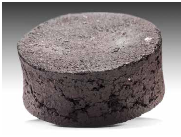
Pan de cochinilla [grana cochinilla procesada y moldeada en forma de pastilla para su uso tintóreo], Oaxaca Cat.

La gama semántica del término tlapalli indica que la cochinilla se percibía como material colorante por antonomasia