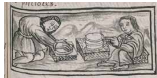
Fray Bernardino de Sagún (Reino de León, 1499 – México, 1590) Historia General de las cosas de la Nueva España (Códice Florentino), foja 217r, vol. III, 1577 Fig.