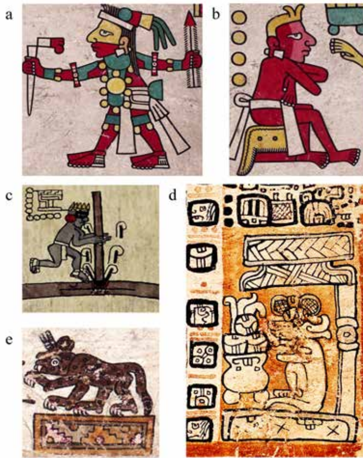
Autor no identificado a) Códice Laud [detalle], foja 17, siglo XVI Bodleian Libraries, University of Oxford, Inglaterra b) Códice Laud [detalle], foja 33, siglo XVI Bodleian Libraries, University of Oxford, Inglaterra c) Selden Roll [detalle], siglo XVI Bodleian Libraries, University of Oxford, Inglaterra d) Códice Tro-Cortesiano [detalle], foja 68, siglo XV Museo de América, Madrid e) Códice Bodley [detalle], foja 14, 1519-1521 Bodleian Libraries, University of Oxford, Inglaterra