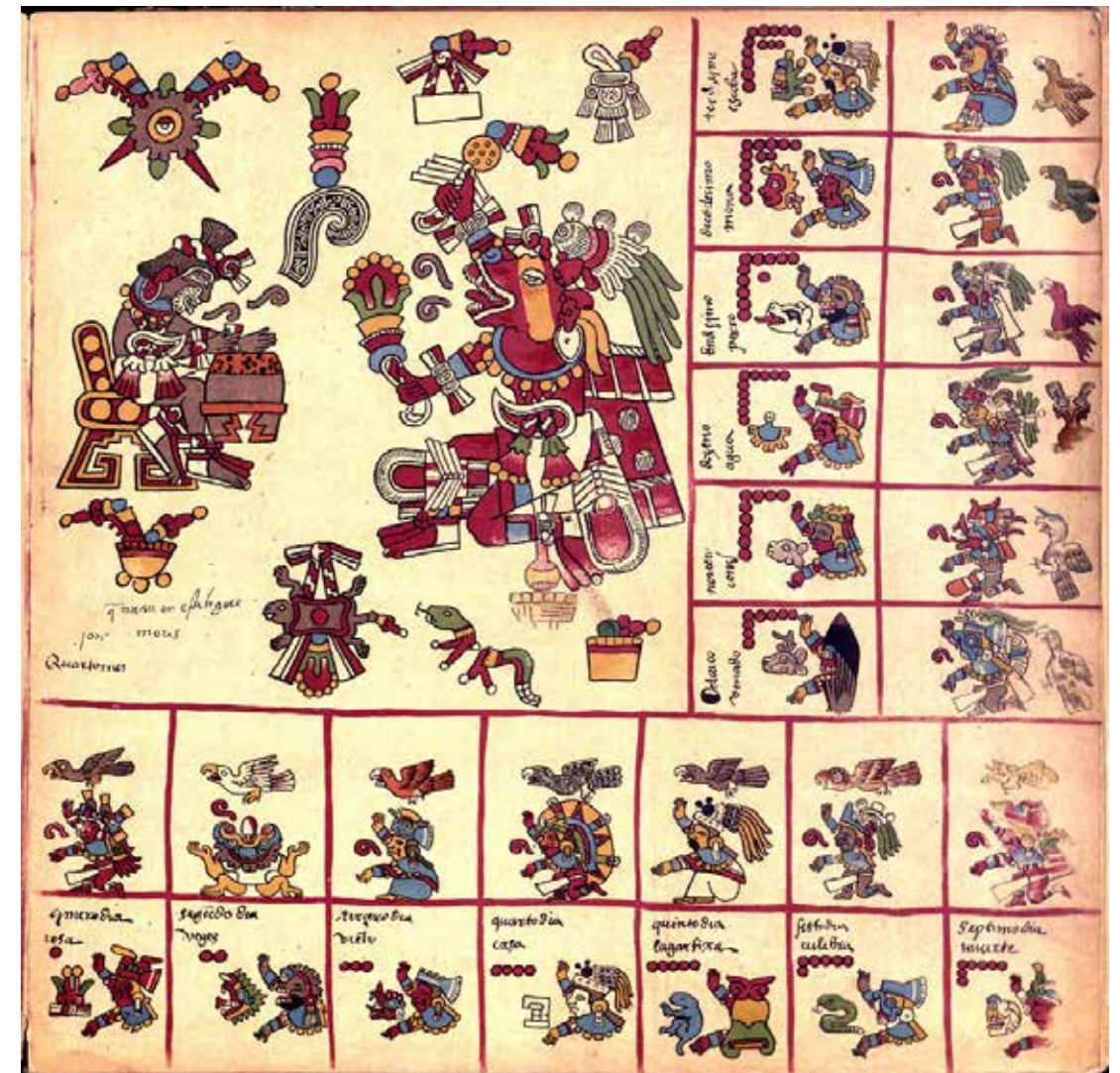
Autor no identificado Códice Borbónico, foja 4, siglo XVI Fig.

En síntesis, los análisis sobre códices prehispánicos han confirmado el papel central que la cochinilla tenía en la paleta de los pintores de códices de las regiones de la Mixteca y de la región de Puebla-Tlaxcala, es decir, de aquellas regiones en donde de manera preponderante se daba la producción de la cochinilla misma; lamentablemente no conocemos