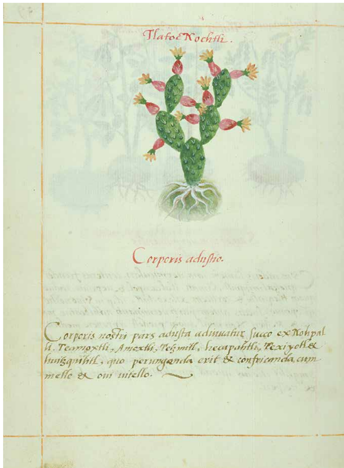
Juan Badiano (activo primera mitad del siglo XVI) Martín de la Cruz (activo primera mitad del siglo XVI) Códice de la Cruz Badiano, 1552 Fig.