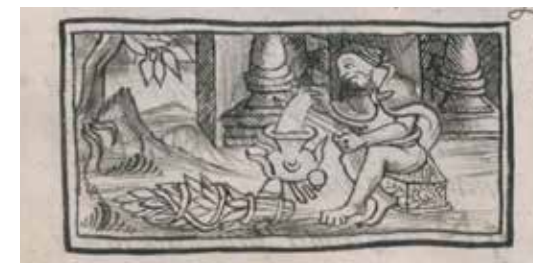
Historia General de las cosas de la Nueva España (Códice Florentino), foja 218v, vol. III, 1577 Fig.

sia entre los pintores de códices, y no es casual que su descripción sea la primera de la sección que Sahagún dedicó a estos artistas. Ya que el conocido difrasismo náhuatl in tlilli in tlapalli , "el negro, el rojo", se refería a los colores de los códices y, metafóricamente, a la sabiduría, no parece atrevido decir que en la época prehispánica la cochinilla materializaba uno de los valores príncipes de la cultura nahua.