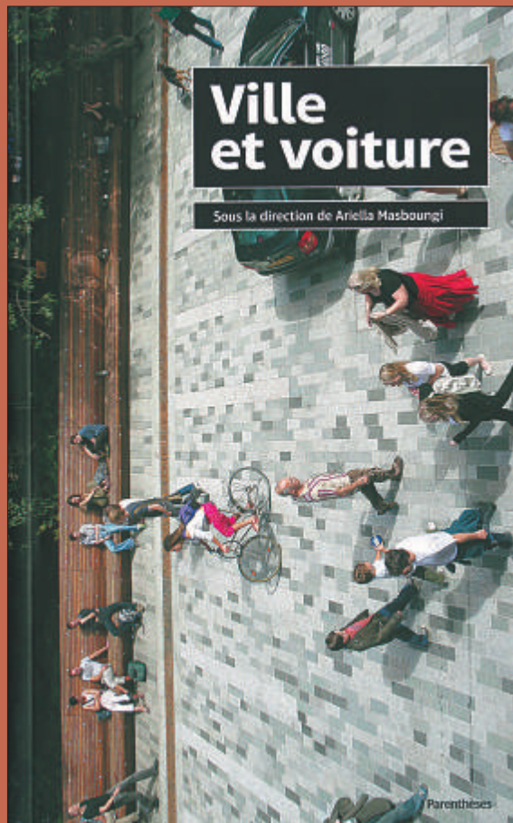
Ministère du Logement, de l'Égalité des territoires et de la Ruralité Éditions Parenthèses Prix : 24 €

En distinguant trois types d'espaces urbains – la ville-centre, la ville intermédiaire et la périphérie – l'ouvrage explore les pistes d'un nouvel équilibre urbain basé sur la prise en compte des déplacements piétons, la mobilité multiple, l'hybridation de modes de transport et le recours aux outils numériques.