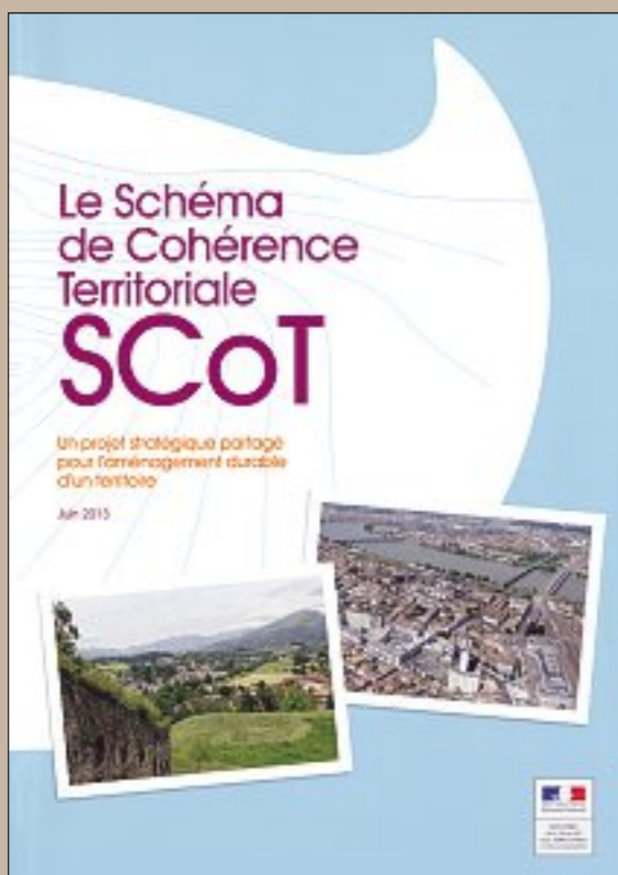
Le Schéma de cohérence territoriale SCOT ministère de l'Égalité des Territoires et du Logement direction générale de l'aménagement, du logement et de la nature Arche Sud – 92055 La Défense cedex Tél. : 01 40 81 97 85 qv3.qv.dhup.dgaln@developpement-durable.gouv.fr www.territoires.gouv.fr