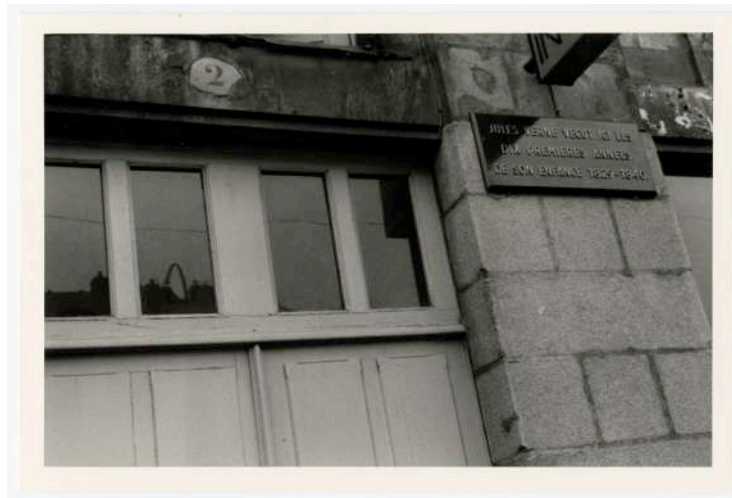
3. Plaque commémorative installée au 2, allée Jean Bart (aujourd'hui cours des 50-Otages), Nantes, 1975. Cette première plaque en bois a été remplacée par une plaque en métal.

Les plaques commémorant la présence de Jules Verne à Nantes, à Amiens et au Crotoy ne font pas exception 35 . Les premières datent de l'année 1928 et rappellent le passage de l'écrivain à deux adresses nantaises (rue Olivier-de-Clisson et rue Jean-Jacques Rousseau) : il s'agit de son lieu de naissance et de l'endroit où il a passé ses premières années. Cette pratique se poursuit jusqu'à nos jours. D'autres plaques signalant le passage de Jules Verne sont ainsi installées dans les années 1970. La plus récente a été conçue pour accompagner la statue représentant Michel Ardan placée en 1986, rue de l'Héronnière, sur le parvis de la médiathèque de Nantes : en l'occurrence – chose plutôt rare –, c'est l'œuvre et non la vie qu'elle commémore, tout comme celle que Christian Robin aurait aimé voir apposer sur la médiathèque elle-même, pour signaler le lieu de conservation des manuscrits de Verne.