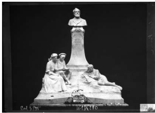
1. Jules Verne [monument en souscription devant être érigé à Amiens, sculpteur Albert Roze], ca 1909, photographie Agence Rol © Bibliothèque nationale de France.

La ressemblance des deux monuments traduit une réception stéréotypée de l'œuvre : le buste s'élève au-dessus d'un groupe penché sur un livre et de quelques éléments évoquant des Voyages extraordinaires . Plusieurs