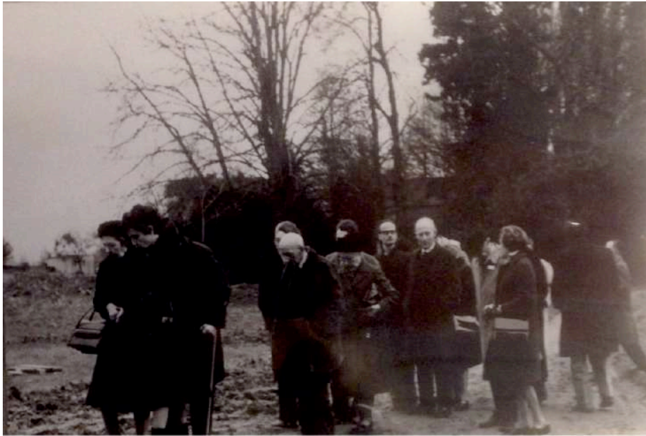
4. Retour du cimetière de La Madeleine, lors d'une réunion de la Société Jules Verne en 1972 © Bibliothèque municipale de Nantes.

La famille de l'écrivain est parfois associée à la création de ces nouveaux lieux de mémoire, comme dans le cas de la plaque installée dans l'ancienne allée Jean-Bart, inaugurée en 1975. Mais ce mode de commémoration est aussi favorisé, parmi d'autres activités, par les sociétés savantes 36 : peu coûteux et rapide à réaliser, il permet par ailleurs d'organiser une progression dans la scénographie de l'hommage, mais aussi d'inscrire les édifices porteurs de ces plaques dans l'histoire littéraire. Il convient ainsi particulièrement bien aux missions de valorisation des monuments et d'entretien de la mémoire que se donnent ces sociétés. En ce sens, il constitue la manifestation locale d'une entreprise mémorielle en pleine expansion, les associations se donnant souvent des ambitions très larges : la Société Jules Verne (1935-1939) est créée à la fois à Liège et à Paris, avant d'être refondée en 1967, et réunit les chercheurs et les fidèles amiénois et nantais en de régulières cérémonies organisées dans l'une ou l'autre ville.