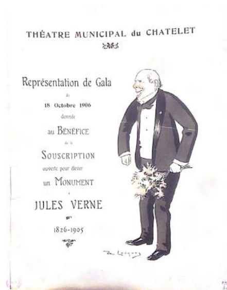
2. Programme de la représentation de gala organisée au Châtelet en 1906, ill. Daniel De Losques © Bibliothèque municipale de Nantes.

Le buste nantais bénéficie également de parrainages prestigieux au niveau national, bien que les commémorations s'organisent au cœur de la ville. L'ouverture de la souscription donne lieu à une représentation organisée par Gustave Kahn au théâtre de la Renaissance, le 6 juillet 1906.