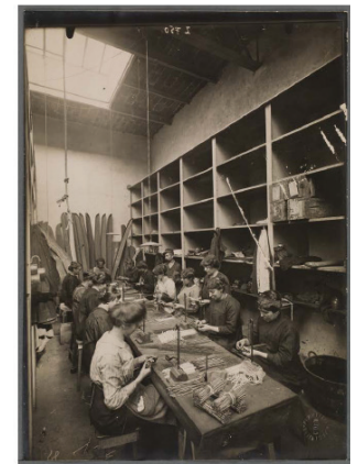
Lyon. Arsenal de la Mouche. Atelier de confection des planchettes pour obus à balles de 75