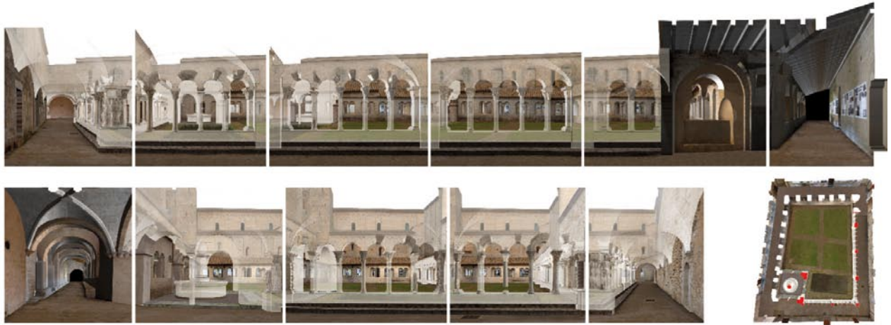
Reconstitution numérique des galeries Sud et Est.