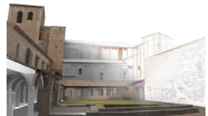
Restitution numérique 3D de l'état actuel.

Quatre phases distinctes (a,b,c,d) ont permis de reconstruire en trois dimensions le cloître avec une précision centimétrique depuis l'analyse métrique des volumes jusqu'à la représentation de l'apparence visuelle des détails.