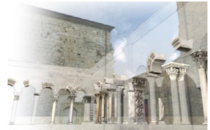
Reconstitution numérique du cloître au XII e siècle.

Les données recueillies et produites pendant les étapes de ce projet sont enfin intégrées à l'intérieur d'un dispositif de représentation qui associe la géométrie restituée à partir de la numérisation des objets réels à celle élaborée en interprétant les hypothèses formulées par les historiens : la représentation de l'état des galeries sud et est au XII e siècle est ainsi superposée à l'état actuel du cloître.