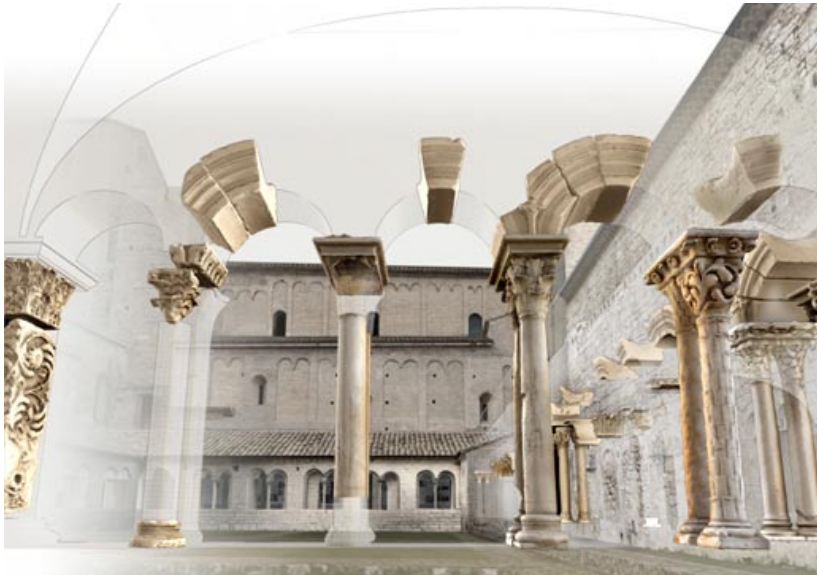
Le Cloître de l'Abbaye de Saint-Guilhem-le-Désert. Restitution 3d de l'état actuel et reconstitution numérique du cloître au XIIème siècle.