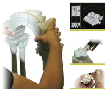
Maquettes physiques des éléments numérisés.

Ce projet a été l'occasion d'appliquer pour la première fois une méthodologie complète de structuration d'informations hétérogènes (métriques, morphologiques, géométriques, descriptives) au sein d'une base de données accessible sur Internet. Un tel système pourrait ainsi devenir demain un outil de référence pour analyser les objets en les manipulant à distance.