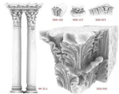
Numérisation d'éléments sculptés.

Cette étape vise à réunir dans un espace virtuel un ensemble significatif d'éléments représentant l'état des galeries sud et est du cloître au XIIe siècle.