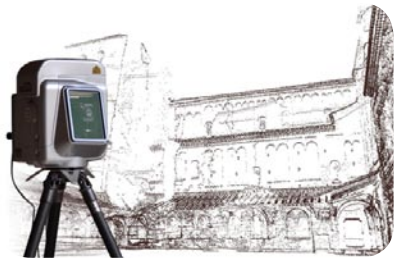
Nuage de points produit lors de la campagne de relevé à l'aide d'un scanner laser 3D.