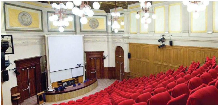
Amphi Abbé Grégoire