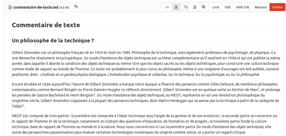
Figure 1 : capture d’écran de la plateforme GitLab

Dès les premiers travaux préparatoires – commentaires de texte et analyses de cas – les directeurs ont pu commenter voir valider les textes via cette plateforme. Nous n’abordons pas en détail le fonctionnement, mais la figure 1 illustre ce premier accès.