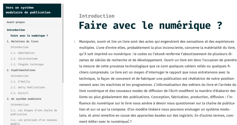
Figure 2 : capture d’écran du site web https://memoire.quaternum.net

Plus lisible et accessible que la plateforme GitLab, ce site web est composé de plusieurs pages web – une page par sous-partie, les sous-parties formant une partie. Un menu permet une vue d’ensemble et une navigation dans le mémoire. Chaque paragraphe est numéroté pour pouvoir facilement préciser sur quelle partie précise porte une remarque. La question de la citabilité d’un fragment numérique – qui par définition peut évoluer – est délicate , d’autant plus lorsque l’objectif est d’ajouter la dimension de versionnement [5] .