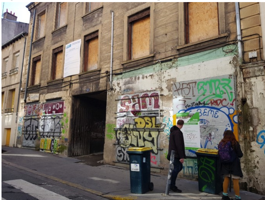
Figure 1. Rez-de-chaussée murés dans le quartier du Crêt de Roch (2018)