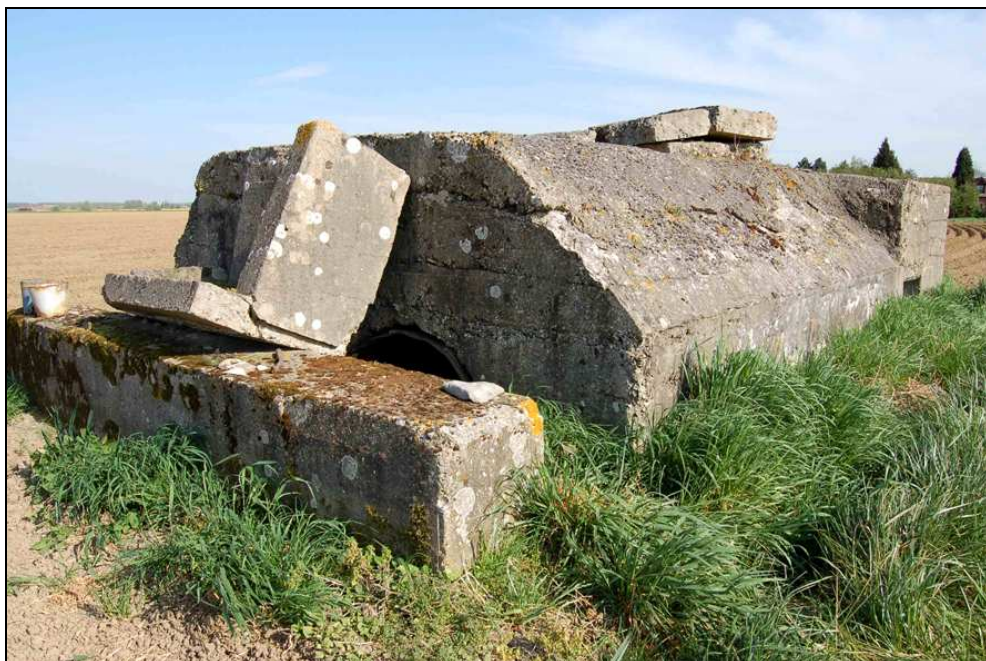
Abri construit en béton armé à Fleurbaix par les soldats britanniques

Des photographies réalisées par Rossella Piccinno, vidéaste et plasticienne, sont aussi installées pour proposer un autre regard sur les « blockhaus ». Puis, une série de photographies historiques et plusieurs productions réalisées par les élèves des écoles révèlent l'ampleur des fortifications de campagne conçues pendant la guerre dans le village de Fleurbaix. Le choix de Fleurbaix, comme première étape de l'itinérance de l'exposition à travers la région, s'explique par la présence dans la commune de plusieurs abris en béton construits par les soldats britanniques en 1918.