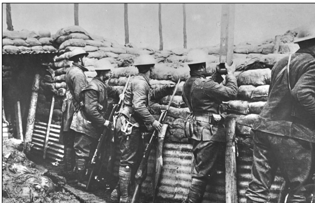
Un soldat britannique s'appuie au parapet d'une tranchée pour observer à l'aide d'un périscope

« À l'abri de ce parapet », le visiteur peut « observer » les fortifications d'en face. Grâce à une mise en scène astucieuse, il découvre l'aspect du front à travers un créneau blindé ou en utilisant un périscope de tranchée.