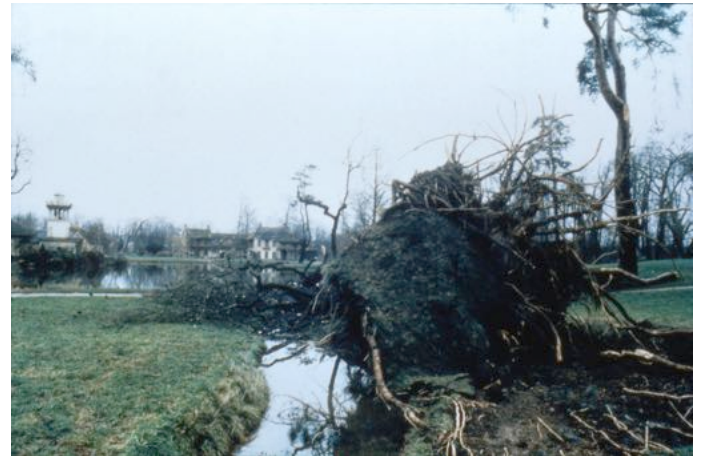
Site Internet du Château, 1999-2001