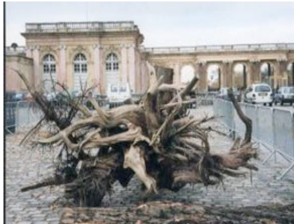
Bois exposés le jour de la vente aux enchères Péristyle du Grand Trianon, 21 octobre 2000

Soigneusement lavés, comme les corps de défunts, ils sont alors exposés devant les colonnes de marbre rose du péristyle du Grand Trianon. Malgré les barrières, les visiteurs tendent les bras pour les toucher, tels de reliques. Le catalogue remis aux acheteurs potentiels renforce d'autant plus le caractère cérémoniel de leur vente. L'histoire de chaque arbre y est retracée brièvement, insistant non pas sur ses propriétés biologiques mais sur ses relations avec des figures historiques légendaires.