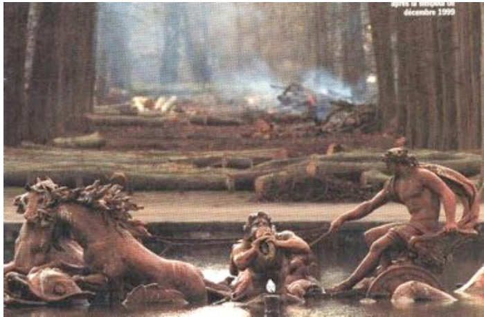
Le bassin d'Apollon après la tempête de 1999, © Pascal La Segrétain, Sygma

Cette fois c'est la finesse des sculptures du bassin d'Apollon qui emplit le premier plan alors que dans son prolongement une allée rectiligne, bordée d'un alignement d'arbres verticaux et rigoureusement parallèles voit sa perspective barrée par une accumulation de troncs découpés et posés en travers. La ligne de fuite se perd dans un amas de branchages qui brûlent en arrière-plan. Le nuage de fumée accentue l'effet de chaos, auquel semble répondre le geste vengeur de Neptune et la fureur - ou la terreur - de ses chevaux émergés du bassin. Au premier plan, dos à l'image, un frêle oiseau blanc semble assister impuissant au spectacle. La profondeur de champ accentue le contraste entre un premier plan, net et lumineux, et le flou de l'arrière-plan.