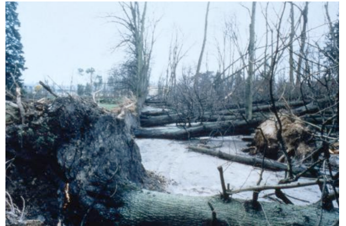
Site Internet du Château, 1999-2001, Vue du hameau de la Reine, et allée du Grand Trianon

Les deux suivantes montrent le hameau de la Reine, dissimulé par des branchages ou de gigantesques souches d'arbres déracinées au premier plan. Sur la dernière photographie, l'allée du grand Trianon disparaît, obstruée par des troncs allongés en travers.