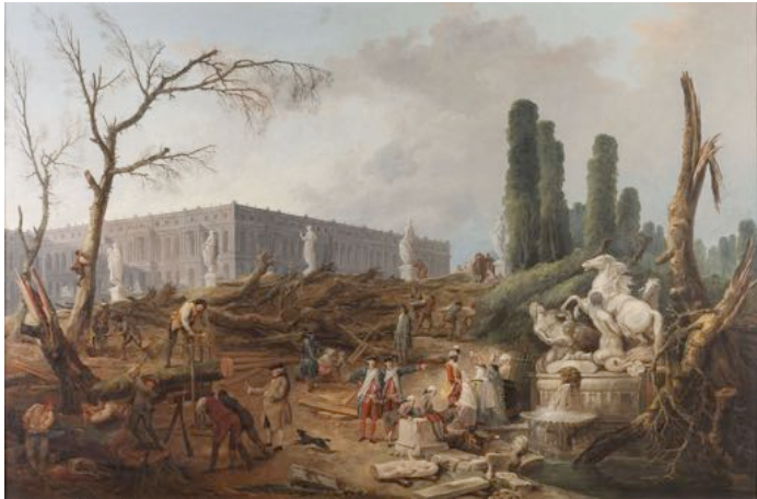
Hubert Robert, Bosquet des bains d'Apollon lors de l'abattage des arbres, 1777