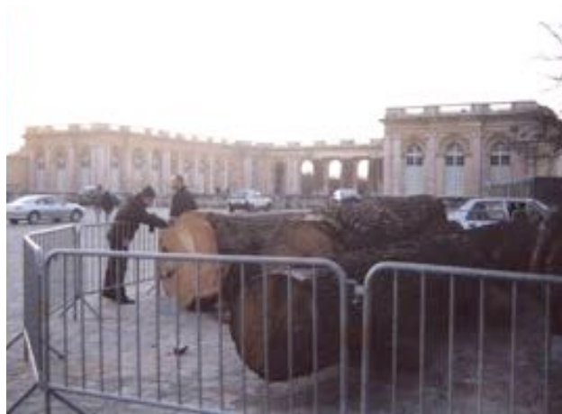
Bois de la tempête, exposés devant le péristyle du Grand Trianon Novembre 2000

Soigneusement lavés, comme les corps de défunts, ils sont alors exposés devant les colonnes de marbre rose du péristyle du Grand Trianon. Malgré les barrières, les visiteurs tendent les bras pour les toucher, tels de reliques. Le catalogue remis aux acheteurs potentiels renforce d'autant plus le caractère cérémoniel de leur vente. L'histoire de chaque arbre y est retracée brièvement, insistant non pas sur ses propriétés biologiques mais sur ses relations avec des figures historiques légendaires.