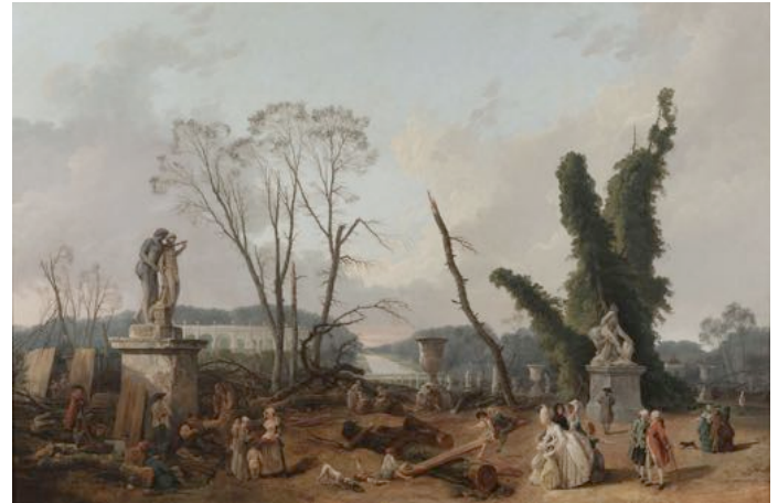
Hubert Robert, L'entrée de l'allée royale lors de l'abattage des arbres, 1777, © Réunion des musées nationaux