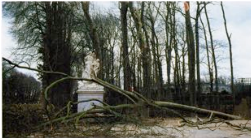
1990, Connaissance des arts

La statue, au centre de l'image, est barrée par un tronc et son socle disparaît derrière des branchages. En arrière-plan, l'ombre des troncs d'arbres restés en place plane comme une menace. Le commentaire explique que « les grands arbres sont devenus dangereux pour le public (une promeneuse a été tuée il y a trois ans), ainsi que pour les sculptures » 3 . L'alignement parallèle des troncs forme une grille de barreaux verticaux car les houppiers n'apparaissent pas sur l'image, comme si les arbres étaient trop grands pour y entrer. Des rares images du parc comme d'autres sites médiatisées en 1990 se dégagent des points communs : les arbres y sont photographiés pour rendre compte de la force des vents ; leur présence permet de visualiser un risque et l'ampleur des dégâts qu'ils peuvent causer. Ils sont une menace.