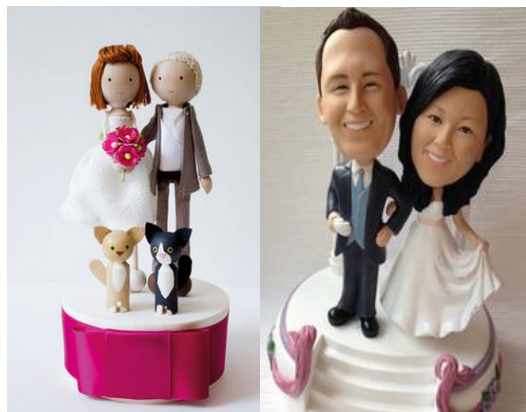
Abbildung 4: Individuelle Tortentopper