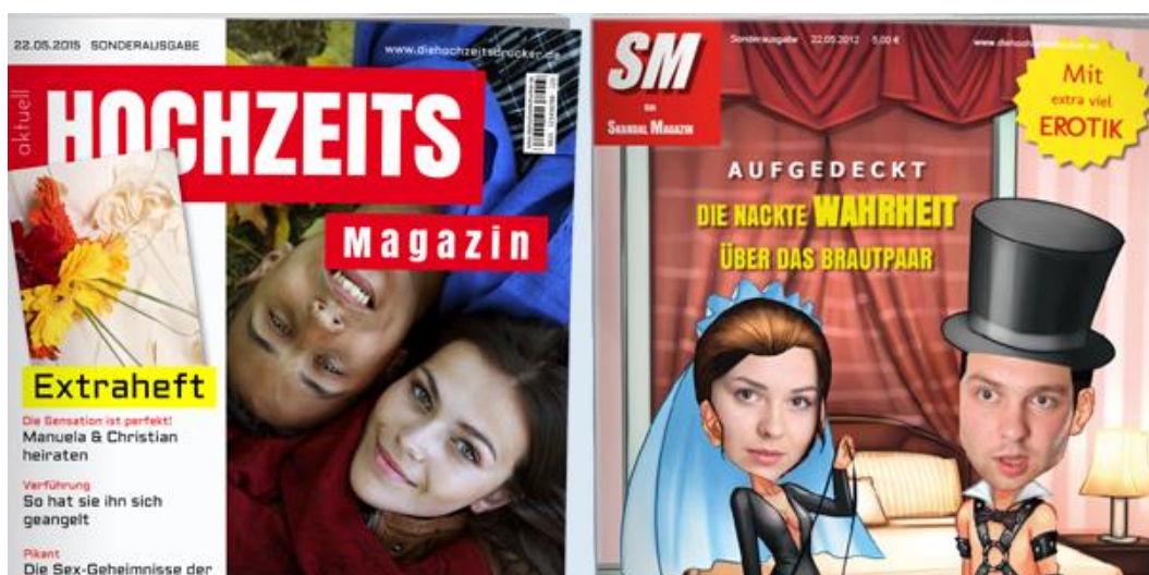
Abbildung 3: Von klassisch bis humorvoll – die Hochzeitszeitung

Quelle: http://www.diehochzeitsdrucker.de/hochzeitszeitung/gestalten-und-drucken