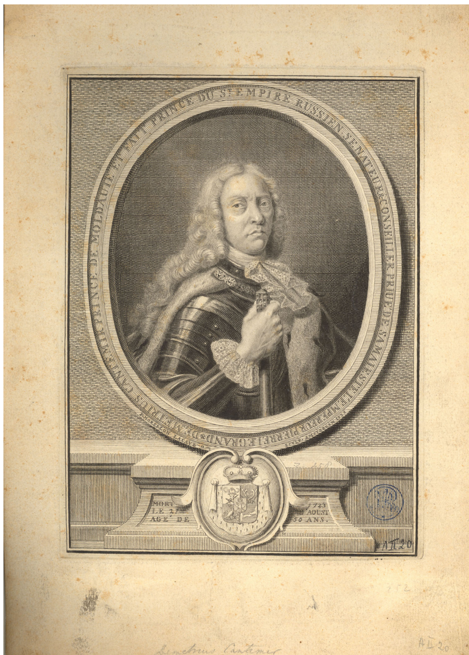
Planche 2. Principatus Moldaviae nova & accurata Descriptio . Delineante Demetrio Cantemirio, A Amsterdam, Chez François Changuon, 1737. Exemplaire de la British Library. © The British Library Board. Maps K.Top.113.64.