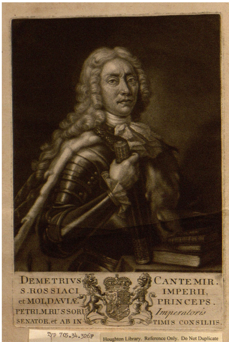
Planche 1. Portrait de Démètre Cantemir, publié en frontispice, à l'édition anglaise de History of Growth and Decay of the Ottoman empire, Londres, 1745, exemplaire à la HoughtonLibrary, Harvard University, EC7.T4922.734c (A)