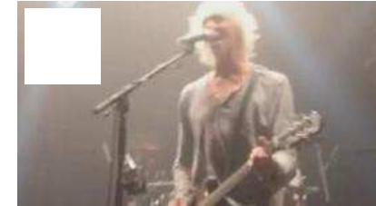
Les Insus en concert à Lille