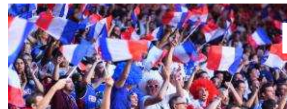
Eurobasket : comment une chanson de Joe Dassin est devenue l'hymne des Bleus