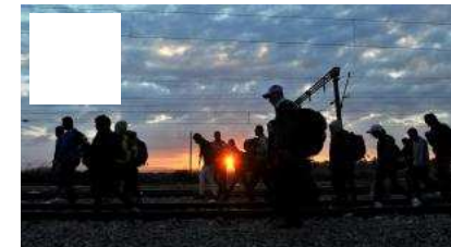
L'Europe divisée sur l'accueil des migrants