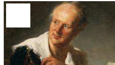
"Fragonard amoureux", une exposition un brin sulfureuse