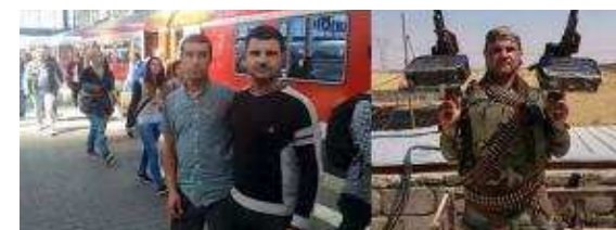
Migrants : six intox qui ont circulé ces dernières semaines sur le web

La défiance tourne parfois à l'agressivité et les conséquences sont dramatiques. Le 19 septembre, en Guinée forestière (région du sud de la Guinée), les membres d'une mission de sensibilisation sur l'épidémie ont été "accueillis à coups de pierres