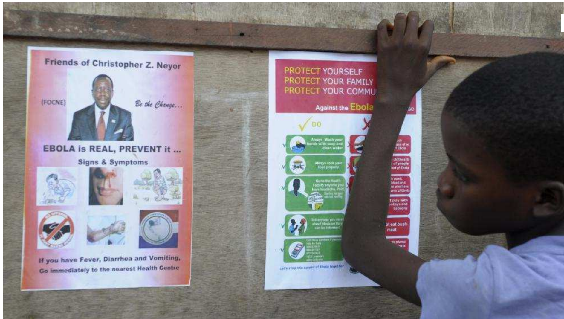
Un garçon lit des messages de prévention sur Ebola, le 17 août 2014 à Monrovia (Liberia).