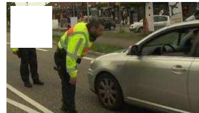
Migrants : la police allemande renforce ses contrôles à la frontière, au niveau de la région Alsace