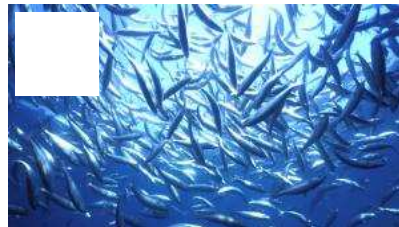
En 40 ans, un animal marin sur deux a disparu