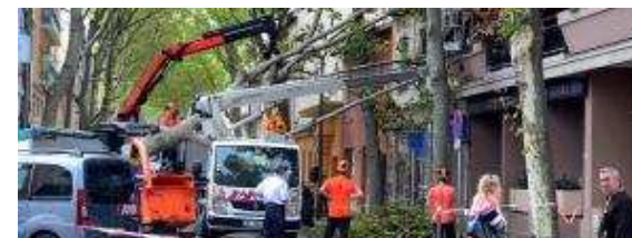
DIRECT. Les vents violents font un deuxième mort en Rhône-Alpes, 18 départements toujours en alerte orange