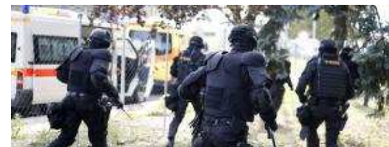
DIRECT. Migrants : la police hongroise fait usage de gaz lacrymogènes à la frontière serbe