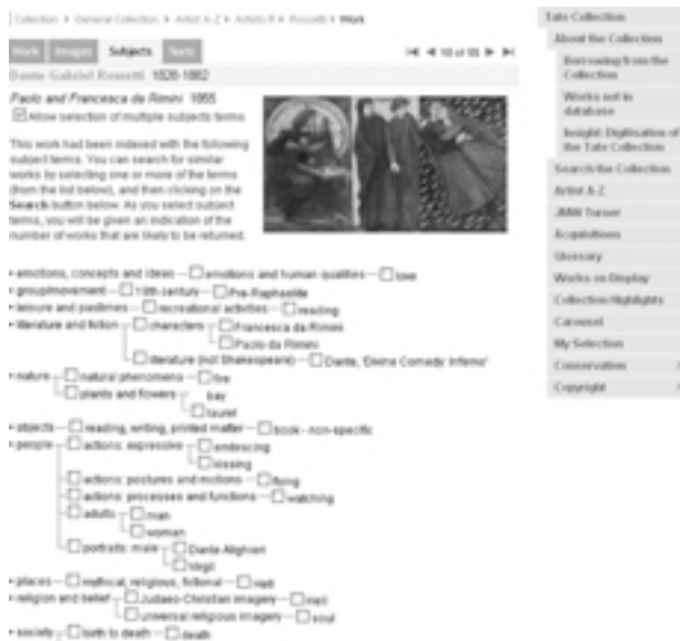
Figure 1: Paolo and Francesca da Rimini, Dante Gabriel Rossetti (1828-1882)

leur attribuer encore un effet propédeutique, quant à l'exploitation de la culture numérique dans le cadre de la discipline. En effet, ces réalisations offrent non seulement des modèles en termes d'instrumentation mais encore elles favorisent la réflexivité. Notamment, leur analyse favorise l'introspection de la discipline sur ses méthodes; c'est le propre de la formalisation drainée par l'instrumentation numérique, dans toutes les disciplines.