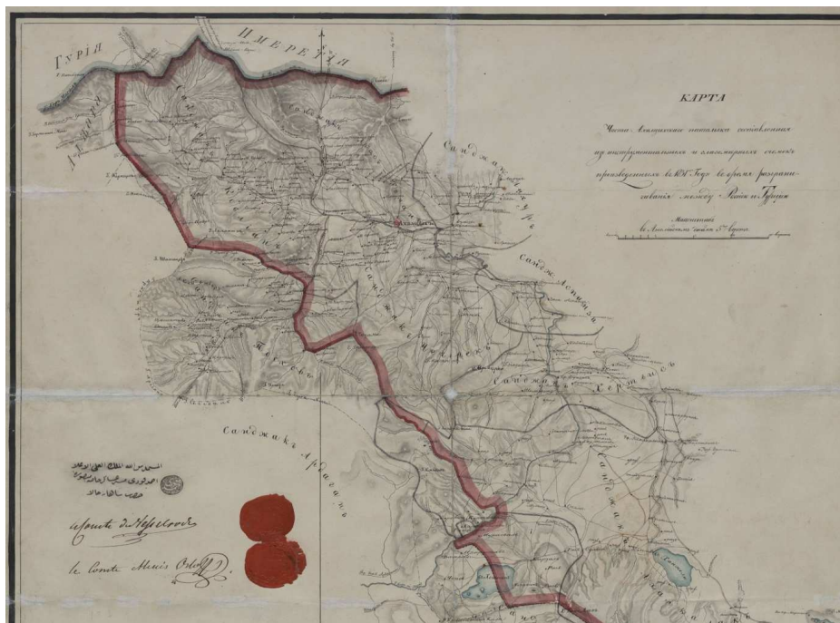
Carte du pachalik d'Ahiska établie en 1831 lors de la délimitation de la frontière entre la Russie et la Turquie

Avec la participation de l'ANR TRANSFAIRE