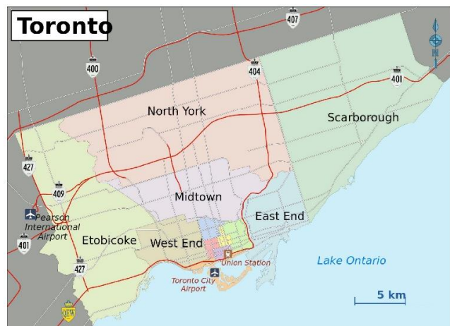
Figure 1. Toronto (Ontario), Canada

Toronto) et leur organisation politique (figures 1 et 2). En effet, les fusions municipales des années 2000 ont étendu la ville de Toronto en lui adjoignant les municipalités voisines de Etobicoke, York, North York, East York et Scarborough, modifiant notamment l'équilibre politique entre la ville-centre très densément peuplée et les banlieues (Horak, 2012). À Montréal, une des conséquences des fusions et défusions municipales des années 2000 est la reconnaissance des arrondissements et de leurs élus dans la gouvernance municipale (Boudreau, Hamel, Jouve, & Keil, 2006). En raison du partage de compétences entre la ville-centre et les arrondissements, on observe une grande variabilité des interventions en faveur du transport actif d'un arrondissement à l'autre. La comparaison inclut également un facteur intéressant de distinction du point de vue de l'organisation administrative, puisque la santé publique est de juridiction provinciale au Québec et municipale en Ontario. La comparaison permet donc de questionner l'influence de ce positionnement administratif sur la capacité des acteurs de santé publique à influencer les politiques municipales de transport actif.