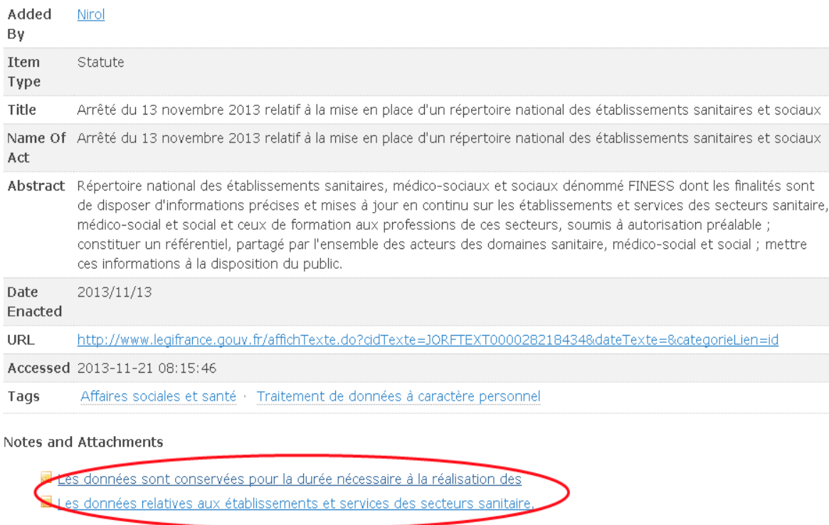
Illustration 1: Exemple de notice