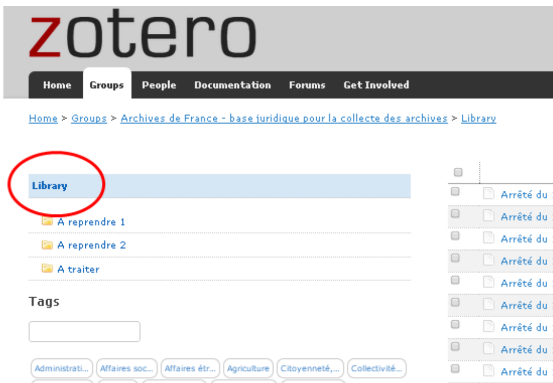
Illustration 3: Faire une recherche – sélectionner « Library »

Les autres dossiers (« A reprendre 1 », « A reprendre 2 » et « A traiter ») sont des dossiers internes au bureau de la gestion, de la sélection et de la collecte qui servent pour la gestion de la base. Ils ne sont par conséquent pas à prendre en compte dans le cadre de vos recherches.