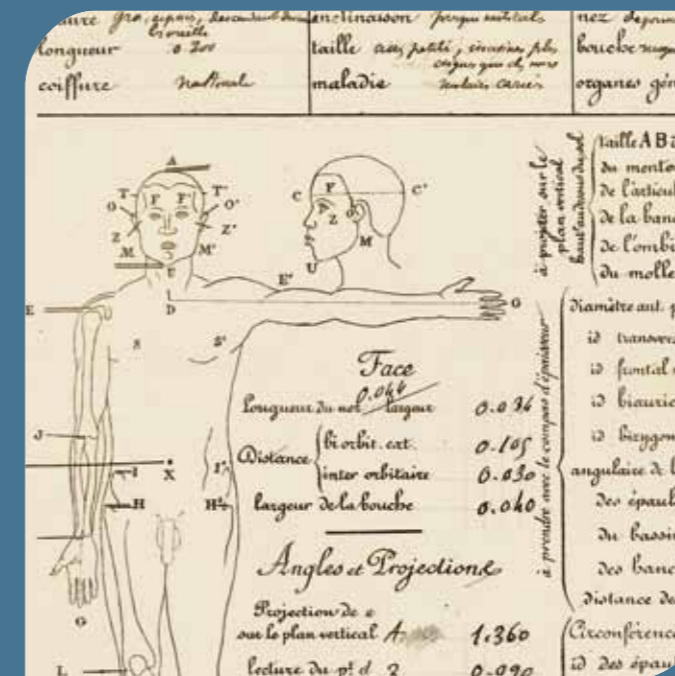
Archives nationales, F/17/2986/A. Études anthropologiques du Dr Maget au Japon : fiche d'observations, dessin d'un marchand chinois et d'un pied japonais, 1881.