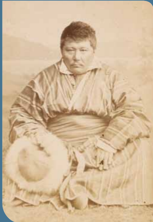
Archives nationales, F/17/3011. Travaux anthropologiques de Charles Ujfalvy chez les Kirghises et Bachkirs, 1881.