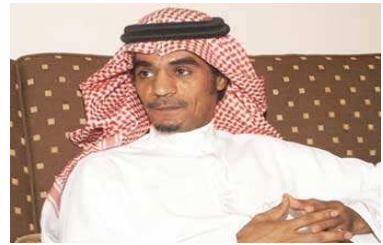
رابح صقر يرفض دخول مصر اعتراضا على قانون النقد بعد ضبط مبالغ مالية ضخمة بحوزته