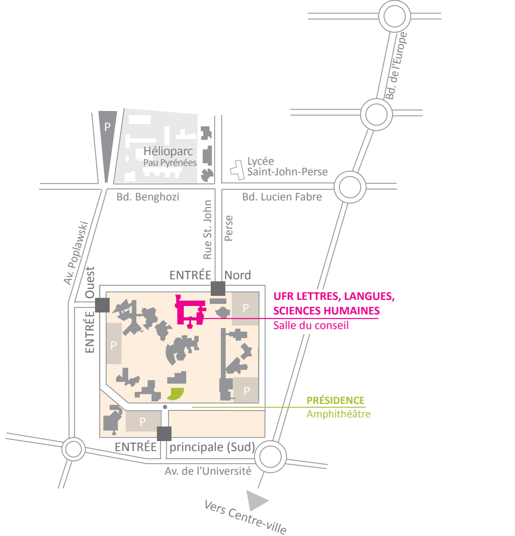
Conception graphique : Direction de la communication - Impression : Centre de reprographie - UPPA