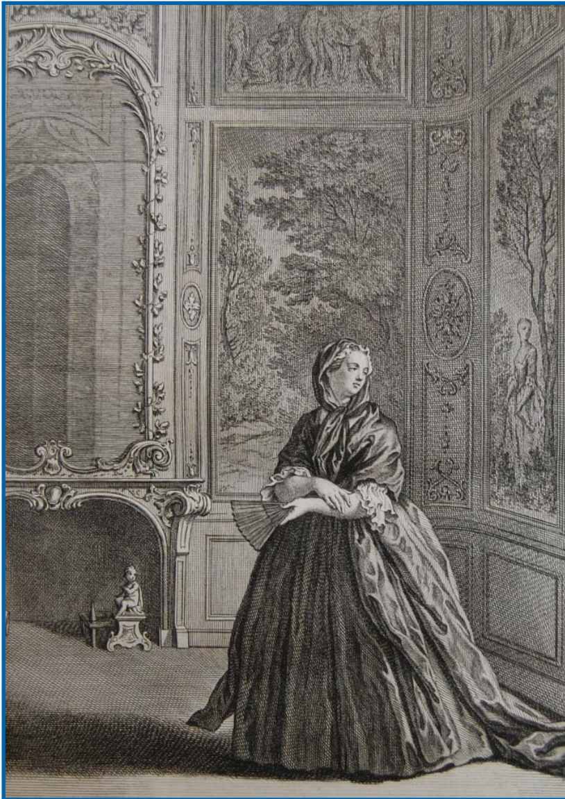
D'après Jean-Baptiste Oudry, La jeune veuve . Fable cxxiv, gravure illustrant Jean de LA FONTAINE, Fables choisies , Paris, chez Desaint et Saillant, 1755, t. II, Bibliothèque municipale de Toulouse, Res A XVIII 1(2).