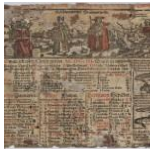
Abb. 4.

Dieser Kalender alten Stils war aber für und in eine/r evangelischen Stadt mit entsprechendem Umland gedruckt worden. 18 Unter Einbeziehung des Konstanzer Kalenders, des evangelischen Umfelds sowie von Frontispiz und Seitenleisten kommt den Fischpaaren in der rechten Seitenleiste eine besondere Bedeutung zu. In einem Einblattkalender von 1571 findet sich genau dieses Frontispiz mit den