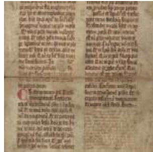
Abb. 1.

Die Ausstattung ist einfach, lediglich eine zweizeilige rote Lombarde markiert den Beginn des Glaubensbekenntnisses. Die Textualis formata stammt aus der 2. Hälfte des 14. Jahrhunderts. Es handelt sich hier um einen Ausschnitt aus einem Missale Romanum mit dem Ende des Canon missae. Auf den Hymnus angelicus Qui tollis peccata mundi folgt das Credo . Damit endet der Canon missae in der b-Spalte. Die ursprünglich leere Spalte wurde dann sehr zeitnah in einer eher flüchtigen Textualis, die noch Einflüsse einer spätgotischen Minuskel aufweist, mit einer Lesung aus dem Epheser-Brief ( Unicuique nostrum ) aufgefüllt. 4 Diese Epistellesung, die üblicherweise an der Vigil zu Ascensio domini gelesen wird, endet auf der ansonsten leeren Verso-Seite.