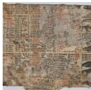
Abb. 3.

Noch ein letztes Fragment ist hier zu besprechen, ebenfalls neuzeitlich und zugleich das inhaltlich interessanteste, das unter der Sammlungssignatur S 201 aufbewahrt wird. (Abb. 3 und 4)