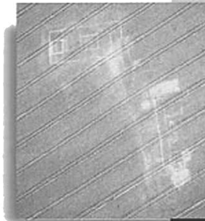
La villa de Peyrolongue à Tauset (Gers).

N.B. Pour cette double conférence, il est conseillé de réserver et de retirer sa place au musée avant le 5 janvier.