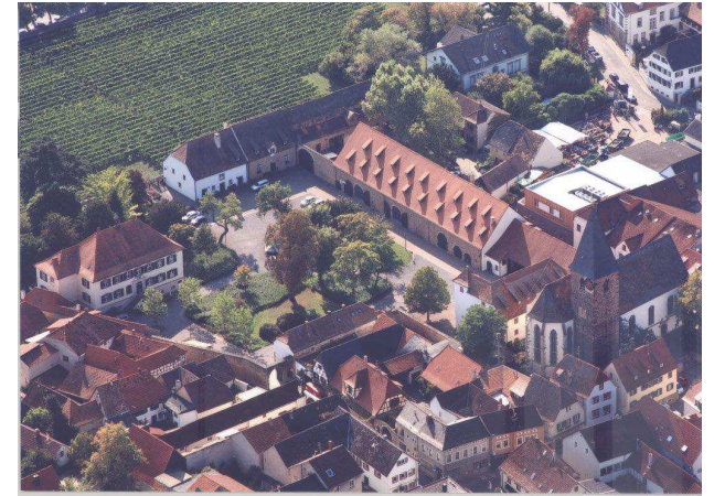
Der Herrenhof in Mußbach