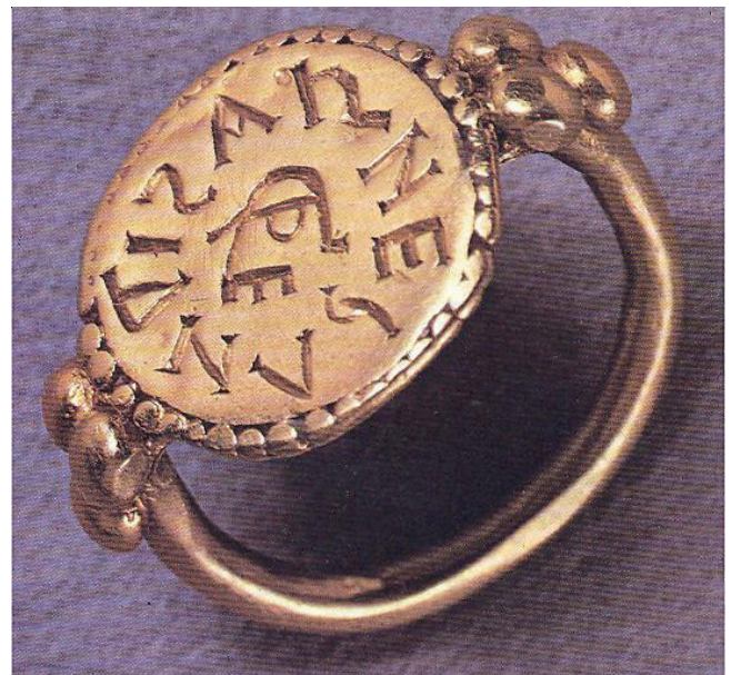
Arnegunde. Goldener Namensring mit der Umschrift ARNEGVNDIS REGINE Arégonde. Bague en or portant le nom ARNEGVNDIS REGINE

Non seulement par la tradition historique mais également et surtout par les découvertes archéologiques de leur nécropoles et du mobilier funéraire, les reines des Mérovingiens dépassent de la masse et équivalaient complètement les tombes royales et « princières ».