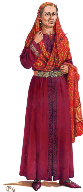
Arnegunde-Arègonde † ca. 575 n. Chr. apr. J.-C.

Tombes aristocratiques des églises de Cologne, Saint-Denis, Chelles et Francfort