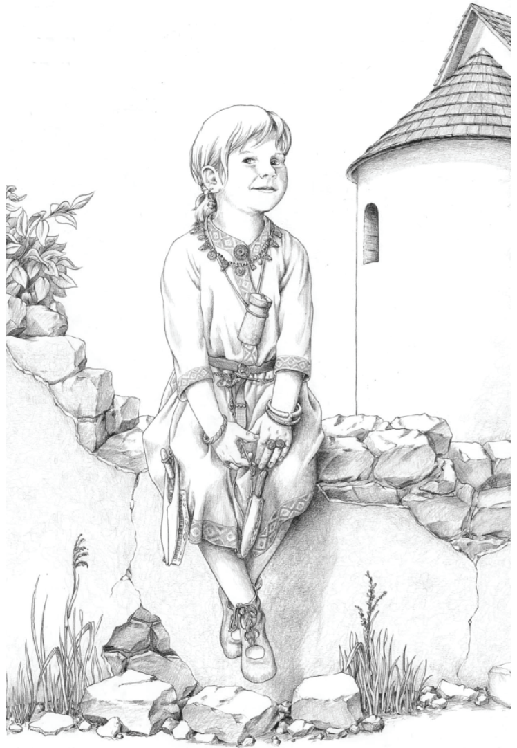
Domgrab Frankfurt am Main oben: goldene Ohringe; unten: Goldlahn-Fäden vom Brokatkreuz des Totenhemds; rechts: Lebensbild des Mädchens