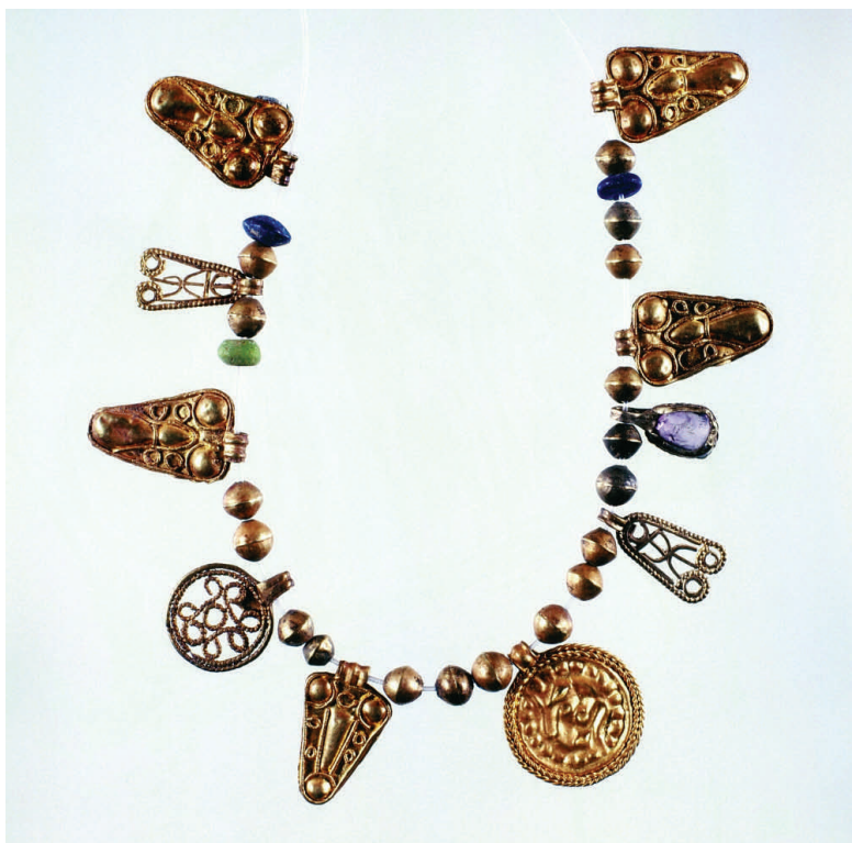
Pektorale aus dem Domgrab Frankfurt am Main Gold, Amethyst und Glas, Ende 8. Jh. n. Chr.

Ergänzen werden wir die merowingischen Königinnen-Gräber durch das reiche Kindergrab , das 1990-91 unter dem Frankfurter Dom aufgedeckt und in den letzten Jahren einer detaillierten antiquarischen und kulturhistorischen Analyse unterzogen wurde. Es stellt sich jetzt als birituelle Doppelbestattung eines 4-5jährigen christlichen Mädchens aus hohem fränkischen Adel, dessen Namen wir leider nicht kennen, und eines weiteren gleichaltrigen Kindes dar, das jedoch nach altgermanischer Sitte in ein Bärenfell gewickelt und verbrannt worden war. Neben der Präsentation der reichen Beigaben und der lebensweltlichen Rekonstruktion der Regentinnen und der "Prinzessin" sollen die archäologischen Befunde der Grablegen als Kirchenbestattungen visualisiert werden. Dazu will die Ausstellung die umfangreichen neuen Forschungsergebnisse, insbesondere zu den Gräbern aus Köln, Saint Denis und Frankfurt erstmals einer breiteren Öffentlichkeit vorstellen.