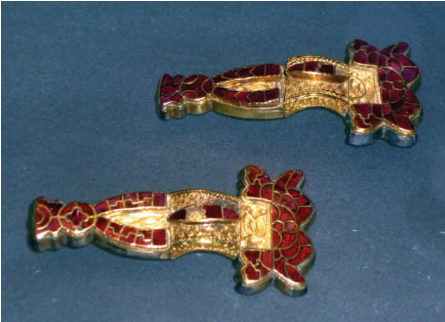
Wisigarde. Frauengrab unter dem Kölner Dom, ca. 535 n. Chr. Silbervergoldete Bügelfibeln (oben); Lebensbild rechts