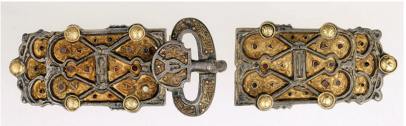
Arnegunde. Silbervergoldetes Gürtelschloss; unten: Sarkophag, heute in St. Denis