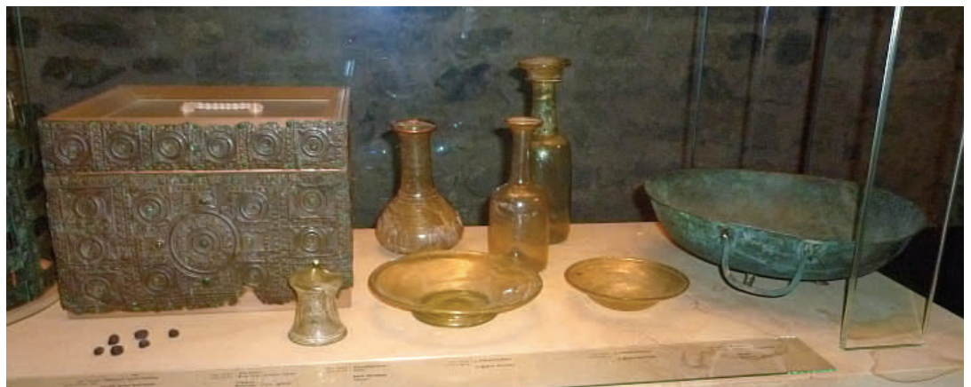
Wisigarde. Tombe féminine sous la cathédrale de Cologne, offrandes de récipients